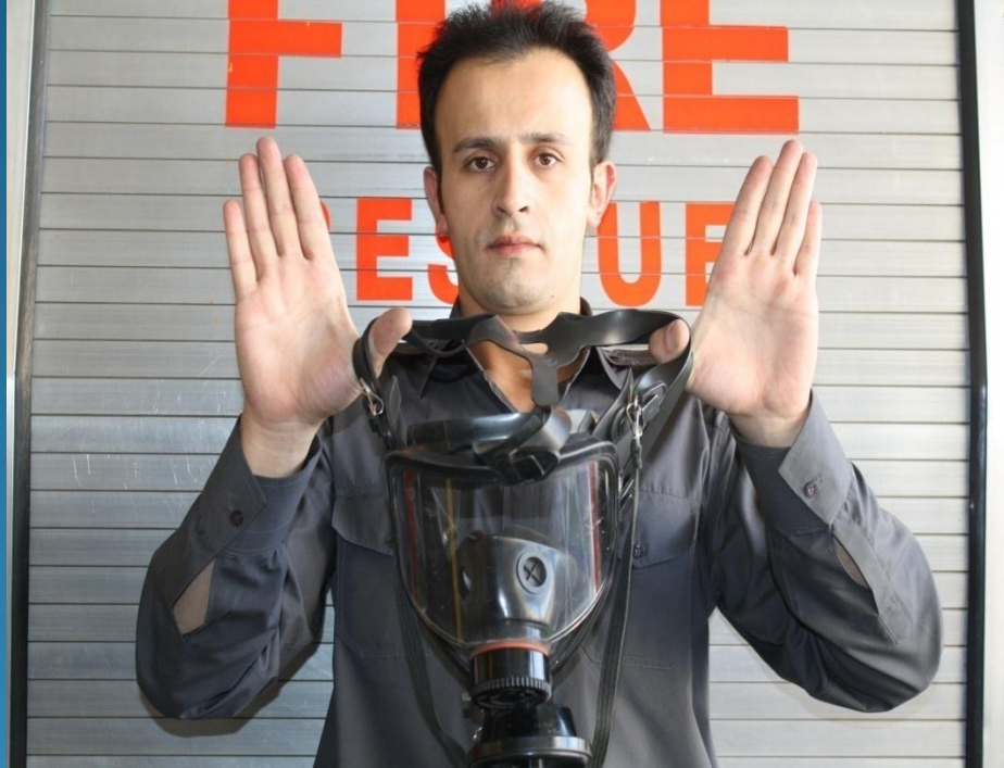
نمونه گرفتن بندهای ماسک با انگشتان شصت

۳- با انگشت شصت دست راست دو بند سمت راست و با انگشت شصت دست چپ دو بند سمت چپ